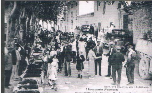
7 Lourmarin (Vaucluse) Cours Philippe de Girard - Marché aux Cerises