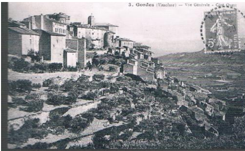
3. Gordes (Vaucluse) - Vie Générale - C. G. G.