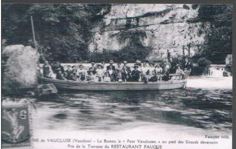
Fauque de Vacluse NE de VAUCLUSE (Vaucluse) - Le Bateau à « Petit Vacluse » au pied des Grands déversoirs Pis de la Terrasse du RESTAURANT FAUCQUE