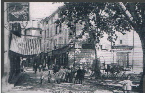
110 - APT - Rue des Marchands