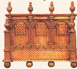
Une lampe huile du XVI e siècle.